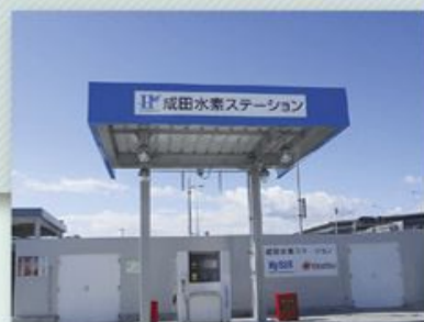
成田水素ステーション