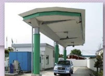
大阪水素ステーション